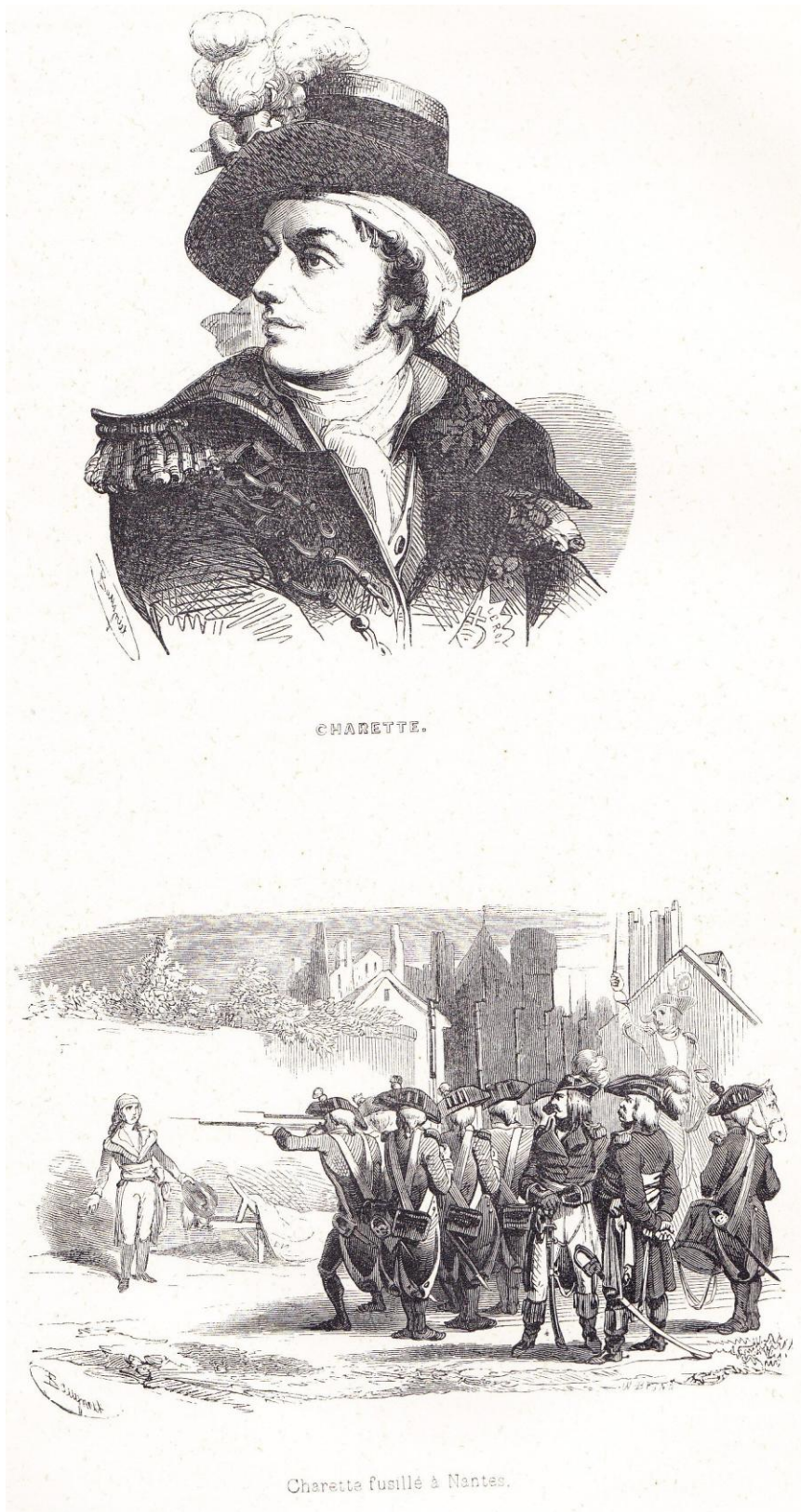
Figure aussi entre pages 282 et 283 (éd. belge) du T2 de Histoire de la Révolution française de THIERS.